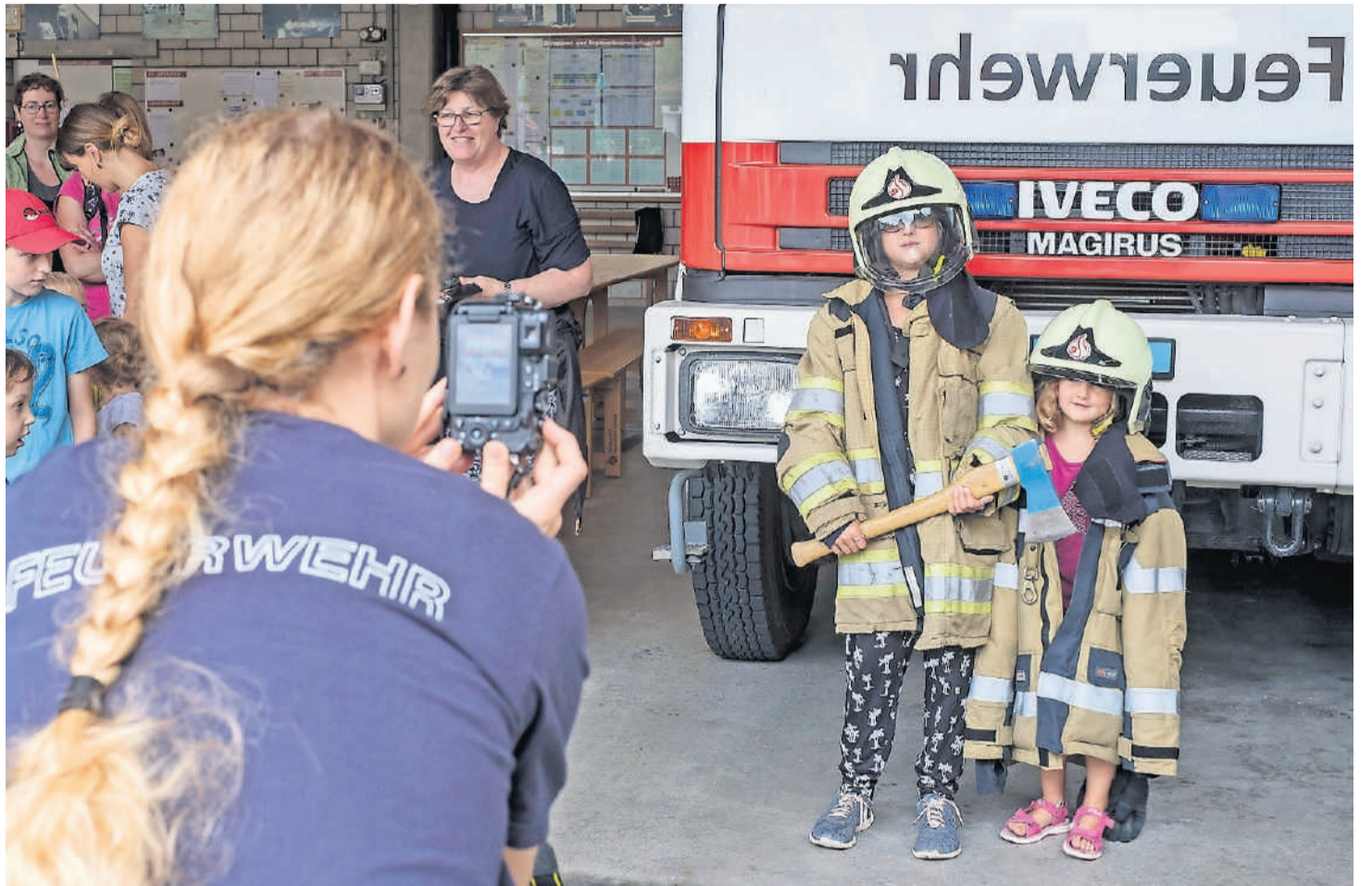
Schon die kleinen Mädchen schlüpfen in die Ausrüstung der Feuerwehrfrauen.

Bilder: Kenneth Nars (Liestal, 7. August 2019)