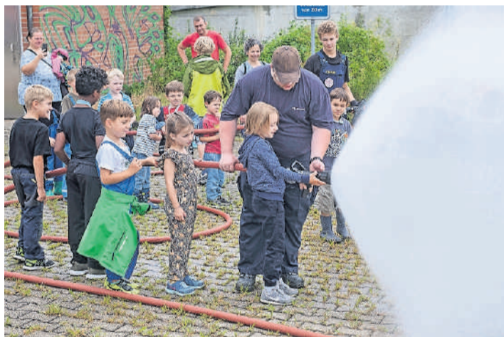
Annäherung an die Arbeit am Strahlrohr.

Bilder: Kenneth Nars (Liestal, 7. August 2019)