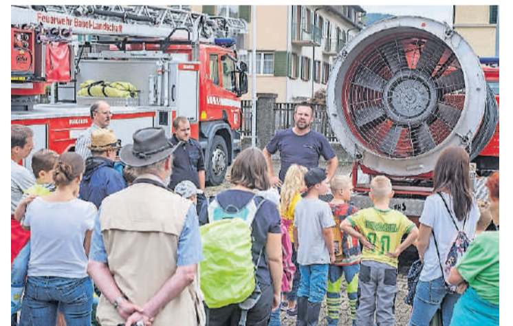
Ein Feuerwehrmann stellt den Riesenentlüfter vor.